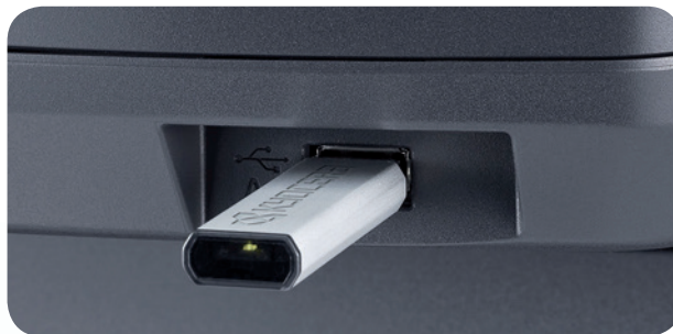
Direkter Druck vom USB-Stick.

Flexibel sind die Geräte auch bei den Speichermedien: Mit der USB-Schnittstelle am Bedienfeld können Sie Dokumente direkt vom USB-Stick drucken.