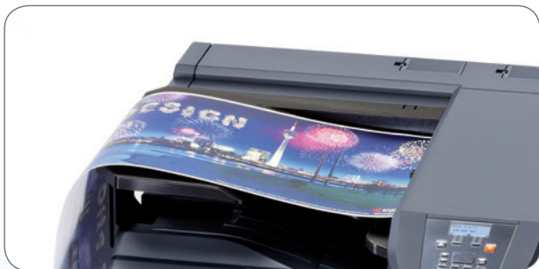
Bannerdruck bis 1 219,2 mm Länge.

Der leistungsstarke Controller und die 160-GB-Festplattenkapazität sorgen auch bei großvolumigen Druckaufträgen für ein rasantes Tempo.