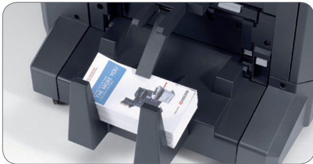
Optionale Broschüren-Einheit für Flyer-Erstellung.

Geringe Aufwärmzeit und bis zu 55 DIN-A4- und 27 DIN-A3-Ausdrucke pro Minute (SW) sorgen für Produktivität der Spitzenklasse.